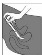
Bild 3. Einmal-Applikator von der Tube abnehmen, möglichst tief in die Scheide einführen (am besten in Rückenlage) und durch Druck auf den Kolben entleeren.

Bild 2. Tube öffnen, Einmal-Applikator auf die Tube aufsetzen, fest angedrückt lassen und durch vorsichtiges Drücken der Tube füllen.